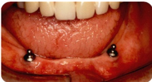
Drukknopjes in onderkaak.

In sommige gevallen wordt er op de implantaten niet een hekje gemaakt, maar op ieder afzonderlijk implantaat een drukknopje.