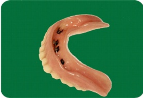
Holte in de (onder)prothese.